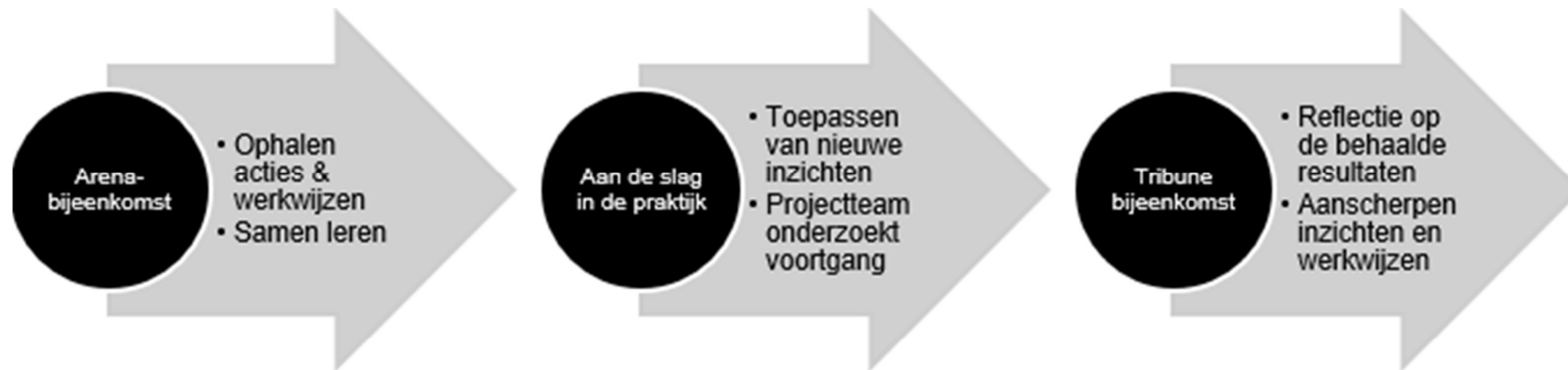
Figuur 2: Werkwijze Arena-Tribune

Arena: Leren door te doen | Tribune: Leren door te zien, te horen en te reflecteren